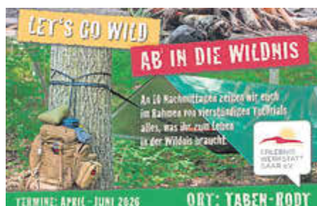
Das Projektplakat der Erlebniswerkstatt Saar lädt zu Abenteuern ein.

Feuer machen ohne Feuerzeug, Lager bauen oder Wildkräuter kennenlernen