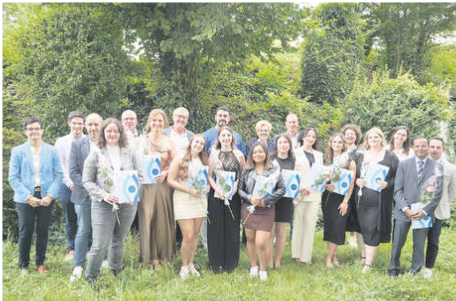
Examensfeier im Kreiskrankenhaus Saarburg: Zehn Auszubildende der Pflegefachschule des Kreiskrankenhauses erhielten ihre Examensurkunden. Direktorium, Heimleitung des Seniorenzentrums, Lehrkräfte und Praxisanleiter gratulierten herzlich. Die Pflegefachschule mit 85 Ausbildungsplätzen bietet jährlich zum 1. Oktober die qualifizierte Ausbildung zur Pflegefachkraft an. Weitere Infos finden sich unter www.kh-sarburg.de

Die Vertreter der Berufsbildenden Schule in Hermeskeil und die Aussteller freuen sich auf die Besucher:innen in der Zeit von 9 bis 12.30 Uhr (Borwiesenstraße 5). Weitere Informationen finden sich unter www.bbs-hermeskeil.de .